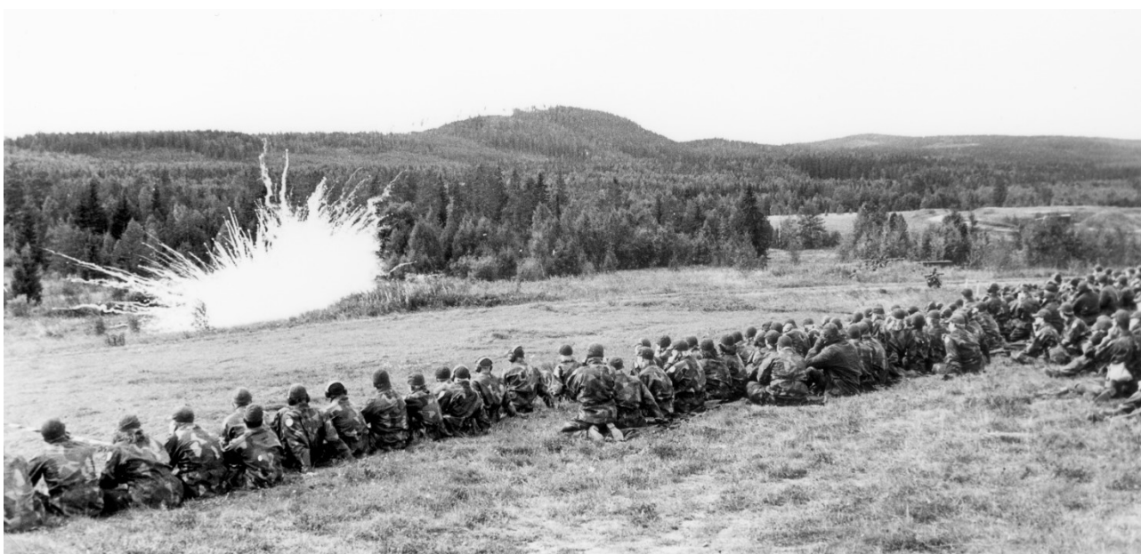
Varje år anordnades en förevisningsövning på skjutfältet för åldersklassen där verkan av bataljonens vapen visades. På bilden ses hur en granatgevärsskytt just skjutit en rökgranat som briserat framför åskådarna.

Tjärnmyrens skjutfält kom att bli regementets viktigaste utbildningsanordning. Där övades med skarp ammunition under realistiska former regementets alla förband i strid. Men det var framför allt där som I 21:s båda brigaders skytte- och granatkastarkompanier, de kompanier vars huvuduppgift var strid, drillades i att med ”eld och rörelse”, stridens grundelement, nedgöra en motståndare.