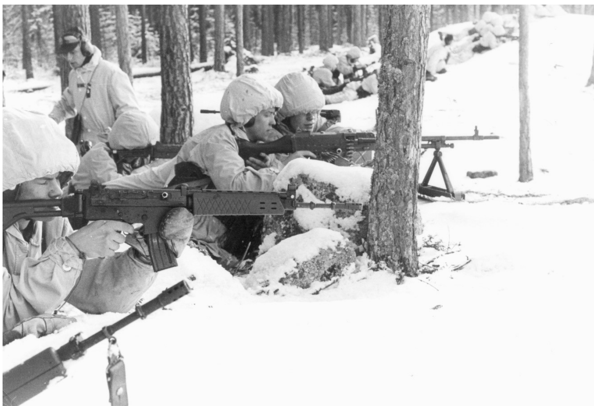
En skyttepluton gör eldöverfall i stridsställningen på Tjärnmyrberget norr om Hamréns kullar. Notera soldaternas bara skjuthänder. Här gällde det att träffa och då åkte den hindrande handsken av även när det var kallt.