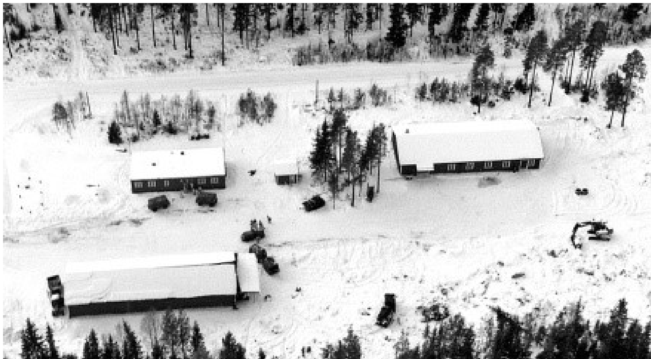
Flygfoto från luften av Nya Berghem 1983 med fr v skjutfältsexpedition med säkerhetscentral. Det lilla huset är ett pumphus och till höger om det ses matsalen. Den stora byggnaden i förgrunden är verkstaden för service, reparation och förvaring av de radiostyrda målen (SAAB-mål). Till höger är arbetet igång för uppförande av en målbod.

Anläggningen som var fullt utbyggd och i gång i början på 1980-talet fick namnet ”Nya Berghem”. Efter omflyttningen revs de gamla byggnaderna i Berghem. I dag används lokalerna i Nya Berghem av hemvärnet och frivilligorganisationerna.