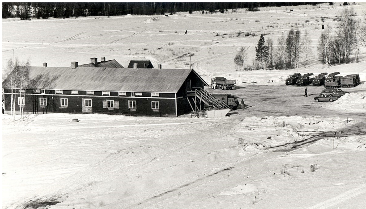
Vinkelladan, förmodligen, en vårvinterdag på 1970-talet. Det står en sjuktransportbil vid trappan på gaveln så det pågår med all säkerhet en stridsskjutning på fältet. Sex bandvagnar 202, tillverkade av Volvo BM AB, står parkerade snett till höger bortom Vinkelladan. På fältet bortom Vinkelladan ses stridsvagnsmål vilka kunde beskjas från Tholinskanästet och Rälsmålbana.